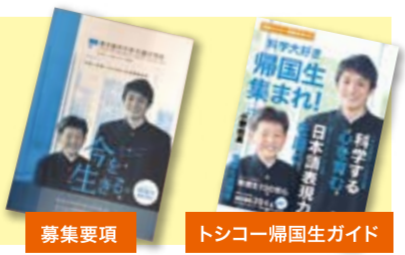
募集要項 トシコー帰国生ガイド